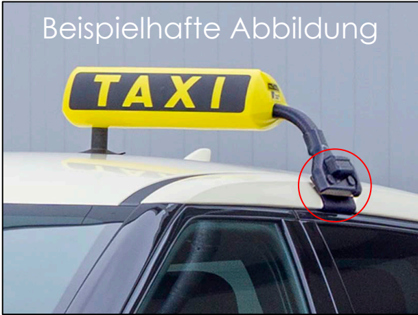
Halterung für Kienzle Argo Dachzeichen