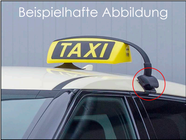
Halterung für HALE Dachzeichen